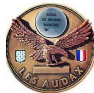
Exemple d'aigle en bronze

Des « aigles » de bronze, d'argent et d'or dans chaque discipline sont attribués aux participants qui couvrent toutes les distances exigées.